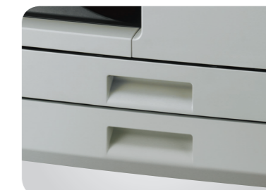
Doplňková kazeta na 250 listů papíru