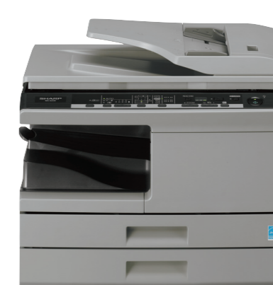
Základní jednotka Jednorůchodový podavač dokumentů Kazeta na papír

Zásoba papíru: 250 listů Gramáž papíru: 56 – 80 g/m 2