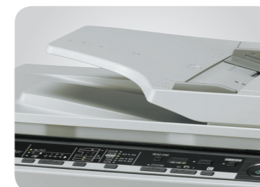
Doplňkový jednorůchodový podavač dokumentů