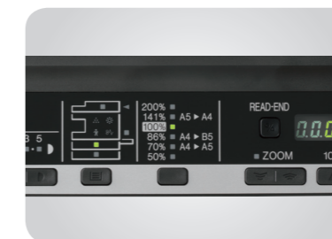
Ovládací panel s LED indikátory